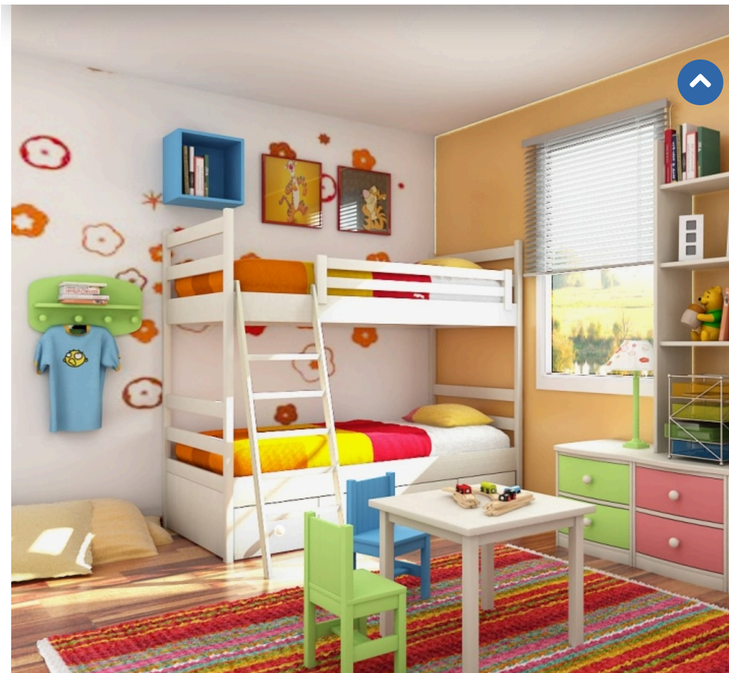
Рис. 1. Детская комната

Стандартными средствами контроллеров VeraLite или Vera такую идею можно воплотить через визуальный редактор сцен. Но страшно представить, сколько придется поставить задержек выполнения сцены и запланировать переключений, чтобы ничего не пропустить, особенно при управлении двумя или тремя источниками освещения. Предлагается более простой вариант – использование готового кода на языке Lua.